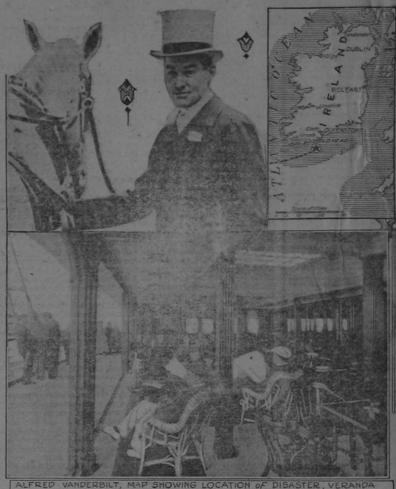
ALFRED VANDERBILT, MAP SHOWING LOCATION OF DISASTER, VERANDA CAFÉ DE LUSITANIA

Hasta se ha admitido la posibilidad de que haya en esto una gran traición de algún empleado de la gran empresa naviera. De todas maneras éstas no son más que especulaciones, pues el "Lusitania" seguía siempre por caminos determinados que son fáciles de conocer previamente.